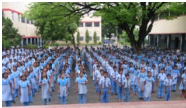
begin van de schooldag in Satenapalli

Het organiseren van basisonderwijs wereldwijd, is een van de acht Milleniumdoelstellingen van de Verenigde Naties. Hoe ver India van de doelstelling verwijderd is, is nog niet bekend.