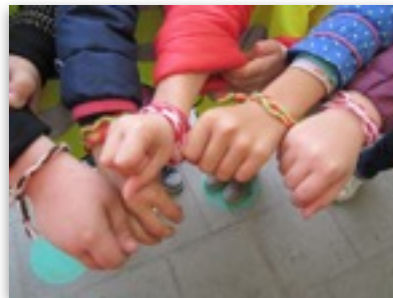
Vrienden geven elkaar zo'n bandje om hun vriendschap te symboliseren

Een rakhibandje stond, in India, oorspronkelijk symbool voor de vriendschapsrelatie tussen broer en zus. Het polsbandje is in de loop van de tijd uitgegroeid tot een vriendschapsbandje. Vrienden geven elkaar zo'n bandje om hun vriendschap te symboliseren als altijddurend (zoals een cirkel). Wie zo'n bandje krijgt zal het dan dragen tot het letterlijk van zijn/haar pols valt.