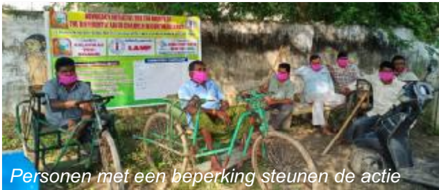
Personen met een beperking steunen de actie

Kort daarop werd in 17 steden een petitie georganiseerd. 3517 mensen namen deel aan deze sensibilisatie actie, waaronder personen met een beperking, ambtenaren en politiciers.